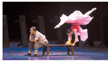
■广州演艺市场蓬勃发展。

品智创中心、国际演出中心、国际演艺消费中心、国际演艺会展中心,让广州成为全球顶级剧目展演的摇篮、人们追求高端艺术的向往之地。广州还将鼓励外资、港澳台资投资设立娱乐场所、演出场所经营单位、演出经纪机构,鼓励原创作品全球首演落户广州,培育“广州首演”“广州首发”品牌。