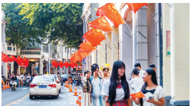
■广州历史底蕴深厚、文化遗产资源丰富。

广州将着力提升城市文化底蕴和品位,传承弘扬广州城市历史文脉,挖掘利用广州红色文化、岭南文化、海丝