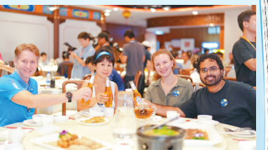
■“食在广州”金字招牌享誉世界。

在广州,与美食相遇,几乎是每位游客的妙事。广州还将着力培育餐饮名店、名厨、名品、名宴,升级传统粤菜馆、老字号餐饮店,推进“老店焕新”,引进国际知名餐企餐饮品牌首店,打造多样化餐饮集聚区;弘扬粤式饮食文化,