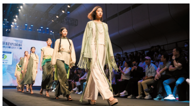
■广州国际时尚“朋友圈”不断扩大。

相关负责人表示,将以建设国际消费中心城市为契机,把广州发展成时尚流行策源地、时尚文化交汇点、时尚品牌集聚区、时尚商品集散地和时尚活动荟萃地,打造国际时尚消费风向标。将促进时尚消费,发挥服装、皮具、美妆日化、珠宝首饰、灯光音响、定制家