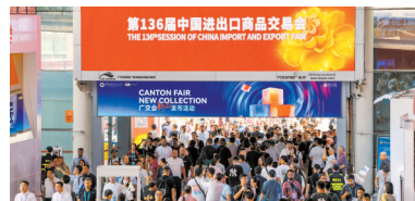
■广交会吸引了世界各地客商。

现时正在举办的第136届广交会,屡创新高,在广州为世界朋友创造链接世界机遇。在此基础上,广州将持续发力建设国际会展中心,扩大广交会的影