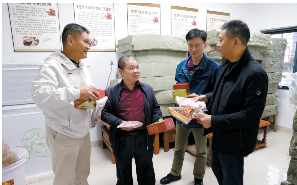
■枫朗镇大埔角村的灵芝种植产业基地成功探索出室内种植灵芝、强村富民的道路。