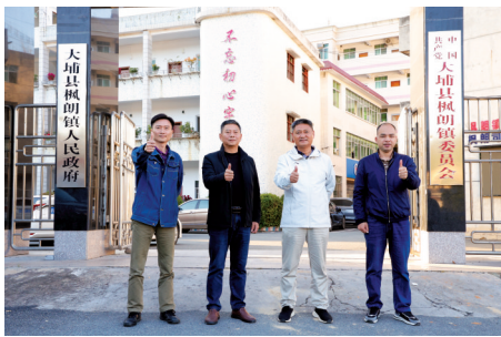
■驻梅州市大埔县枫朗镇工作队合影。