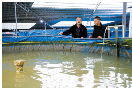
■枫朗镇墩背村与公司合作,从山上引入山泉水养鱼,带动村集体增收,正准备扩产。