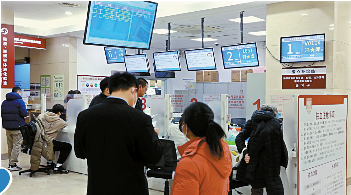
■患者在门诊等待抽血化验。(资料图)