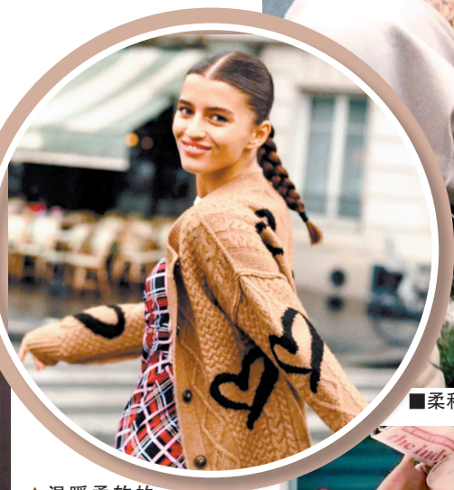
■柔和的棕色与低饱和度的粉能很好融合。