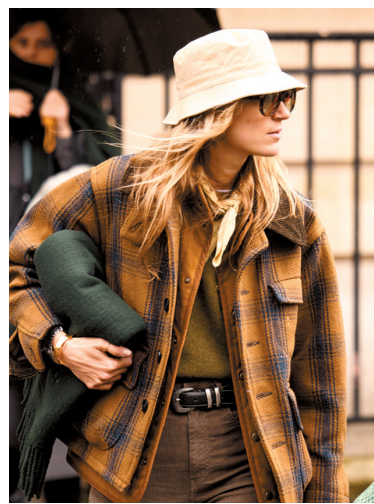
▲搭配同样带有怀旧感的色彩,凸显复古气质。

如担心整体配色太浓烈,可加入衬肤的白色或米白色作为过渡,增加整体造型清爽度的同时,明晰色彩的层次感也能帮助提亮肤色。或叠加冷色调彩色,对比强烈又相互补充。