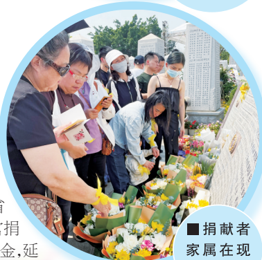
■捐献者家属在现场拜祭。

公益志愿服务队”成立,并在省红十字会的支持下全身心投入到人体器官捐献这一崇高事业中。除了与广州地区医院OPO(器官获取组织)携手开展公益活动,志愿服务队还将深入到省内多地,为生活存在困难的器官捐献者家庭送上生活必需品和慰问金,持续关注 and 温暖。