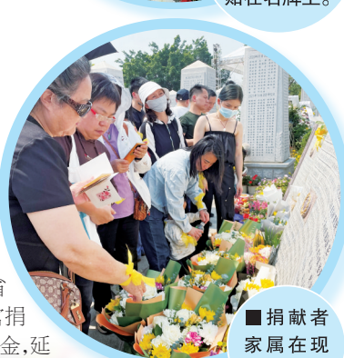
■捐献者家属在现场拜祭。