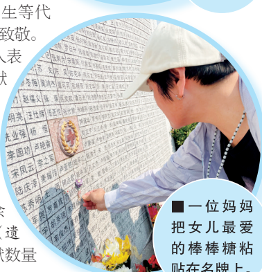
■一位妈妈把女儿最爱的棒棒糖粘贴在名牌上。