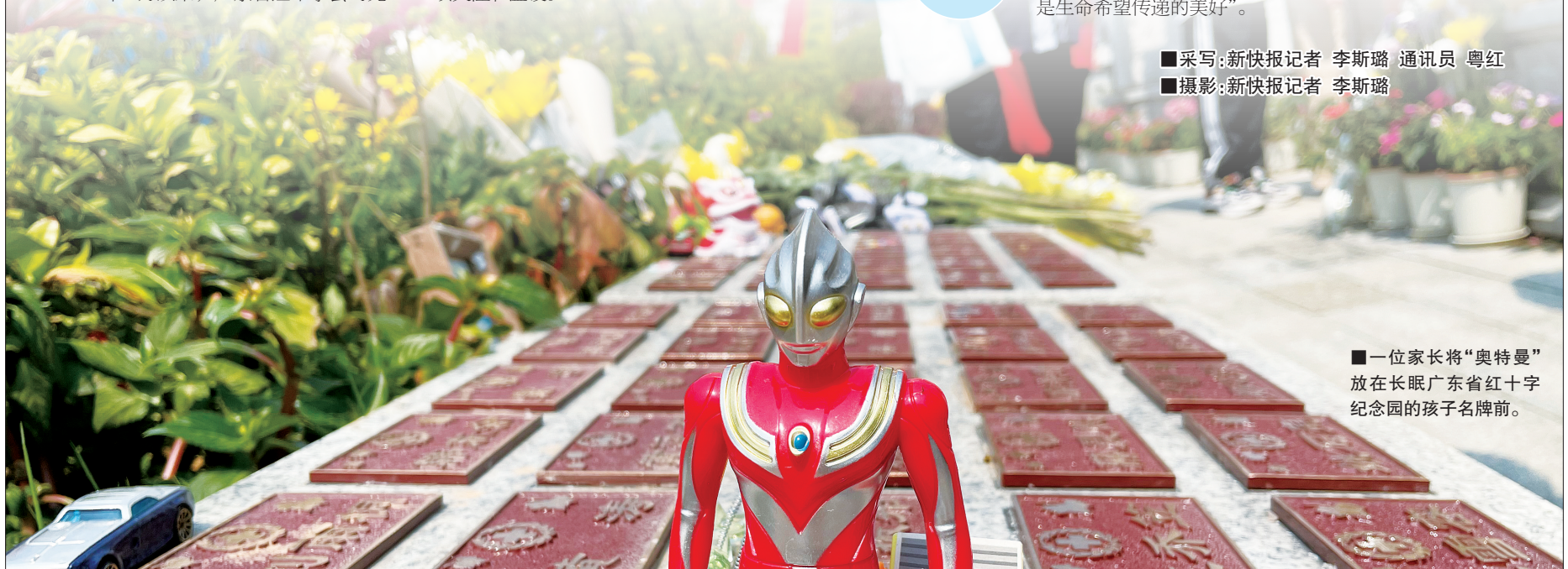
■一位家长将“奥特曼”放在长眠广东省红十字纪念园的孩子名牌前。