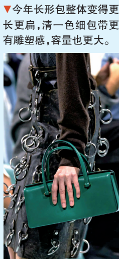
▼今年长形包整体变得更长更扁,清一色细包带更有雕塑感,容量也更大。