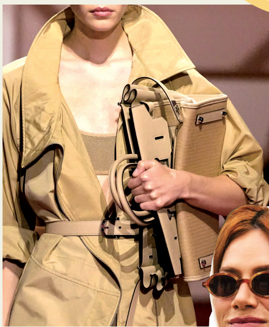
▲可抱在怀中的翻盖包,简约大气的轮廓中带有迷人的复古韵味。

另一方面,今年流行的包包有变“软”的趋势,且不仅停留于饺子包、水桶包这类本身就相对较为松软的包型,而是有些廓形包款也开始使用更柔软的材质,给大尺寸包包实现随手抓起来折叠提供了可行性条件,日常造型穿搭使用不易显得呆板,也让整体造型有了更慵懒舒适的感觉。