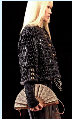
▲不少异形包都能彰显品牌的工艺实力,从而成为包柜中不容忽视的经典款。

包包一贯用来“背”,随着迷你包兴起,不少包包前面跟的动词变成了“拿”,进而一些既定印象中用来肩背的包如运动包、水桶包、法棍包甚至大号托特包等,被时髦精轻松“手托”,显得更有气场,更酷更飒。