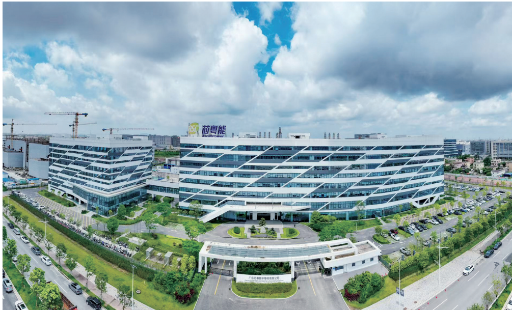
■ 广东芯粤能半导体有限公司。