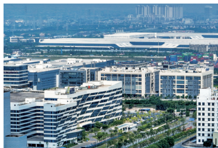
■ 万顷沙集成电路产业园的芯片一条街。