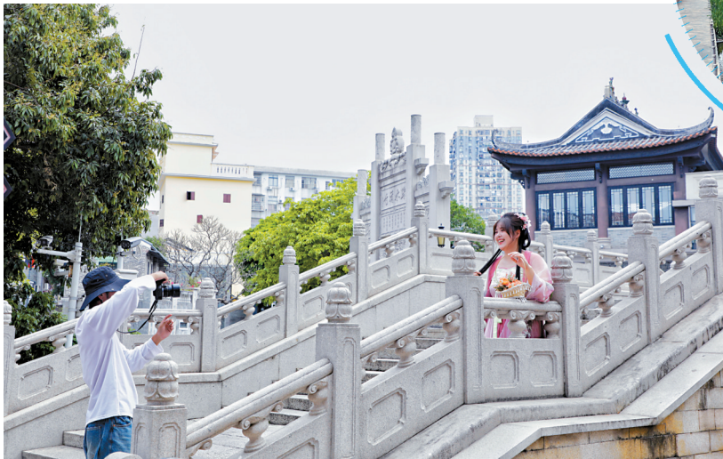
■荔湾区打造宜居宜业宜乐宜游现代化城区。