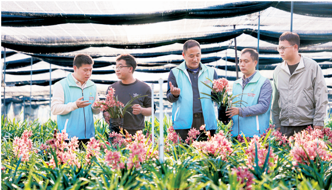
■驻太平镇工作队到九龙兰业基地了解兰花种植、销售及联农带农情况。