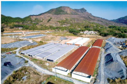
■位于湖洞村的清远清农禽业有限公司。