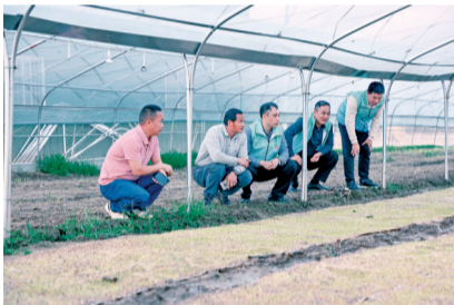
■驻太平镇工作队走进龙塘村清远市阳山县鸿有农业有限公司查看秧苗的长势。