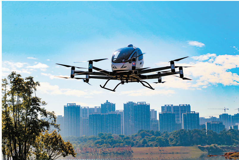
■亿航无人驾驶载人航空器在中新广州知识城九龙湖上空飞行。

OC(Operation Certificate)是民航局向运营商颁发的资质证明,标志着企业具备安全、合规开展商业飞行的能力。至此,亿航的EH216-S无人驾驶载人航空器已获得了全球首个载人eVTOL产品型号合格证(TC)、标准适航证(AC)、生产许可证(PC)和运营合格证(OC),成为全球首家“四证集齐”的企业,正式迈入商业化运营阶段。若将低空经济比作“造车”,适航三证(TC、PC、AC)解决了“车能造”的问题,OC则决定了“车能上路”。