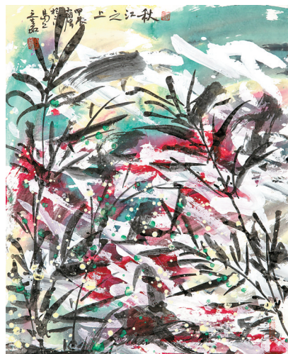
■王嘉 国画《秋江之上》