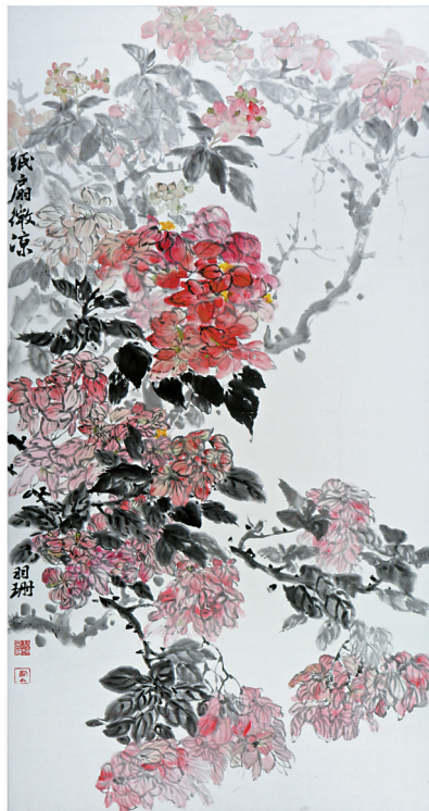
■刘羽珊 国画《纸扇微凉》