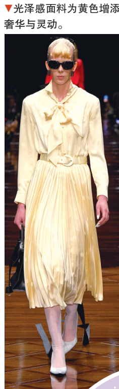
▼光泽感面料为黄色增添奢华与灵动。