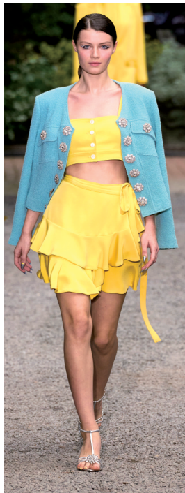
▲冷色调亮色搭配“阳光黄”营造独特张力。