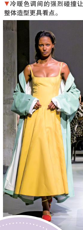
▼冷暖色调间的强烈碰撞让整体造型更具看点。