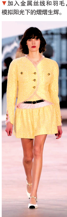
▼加入金属丝线和羽毛,模拟阳光下的熠熠生辉。