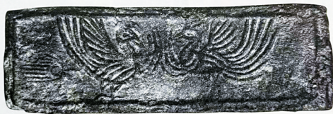
■太康八年八月 十日何氏造 西 晋 公元287年