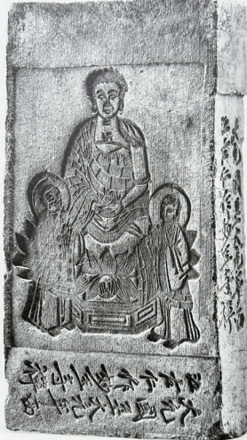
■大元国至大元年西江左仁作 妙玉寺禅 元 1308年