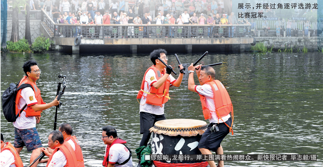
■锣鼓响,龙船行。岸上围满看热闹群众。