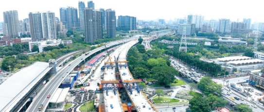
■广湛高铁珠江四线特大桥施工现场。

深江铁路即广东省境内深圳市至江门市的高速铁路,正线全长116.12公里,线路起自新建深圳西丽站,向西经东莞市、广州市、中山市、江门市,接入铁路江门站,全线共设7座车站。建成通车后,将进一步打通沿海通道,江门前往深圳可实现1小时内通达。同时,深江铁路建成通车后将与广深港高铁连接,联通香港,对进一步打造“轨道上的大湾区”具有重要意义。