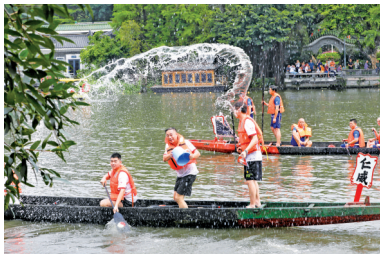
■荔湾泮塘跨越数百年的“起龙”狂欢。

新快报讯 记者谢源源 通讯员荔宣报道 5月5日(农历四月初八),广州荔湾泮塘起龙仪式在广州西关永庆坊旅游区(荔湾湾景区)举行,沉睡在荔湾湖底的7艘龙船被“唤醒”,跨越数百年的“起龙”狂欢奏响了端午龙船季盛事的序章。