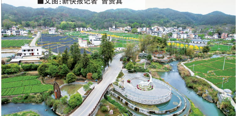
■大崧镇将公路建设与特色农业、乡村旅游深度融合,为群众拓宽增收渠道。