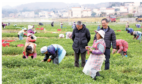
■蔬菜企业让群众在家门口幸福就业。

粤黔长顺小组组长,长顺县委常委、副县长郭海鹏表示,劳务协作是东西部协作“四项行动”之一,是促进长顺群众就业增收的大事,接下来两地将继续加强协作,有效整合双方资源优势,推动“埔顺”劳务协作再上新台阶。