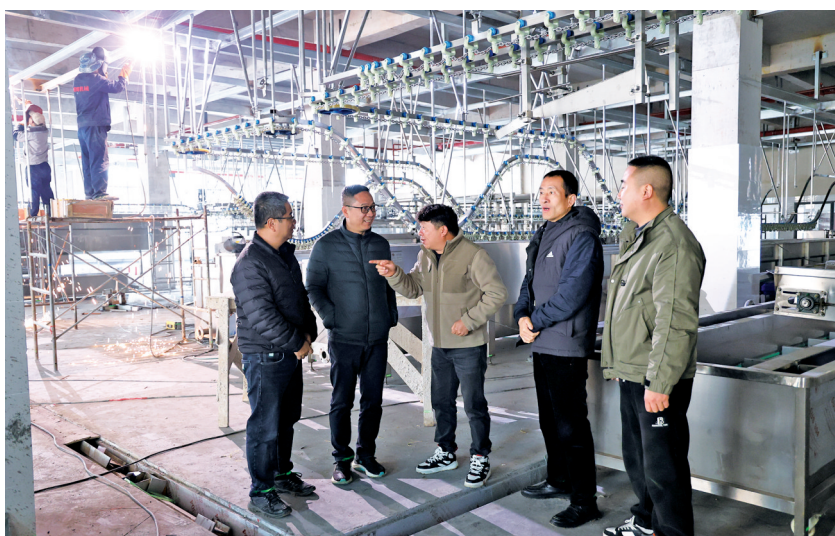
■长顺小组在但家香酥鸭新厂房调研产业发展和未来用工计划等。