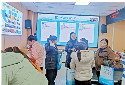
■长顺县人力资源市场(零工市场)服务人员向群众讲解就业政策。