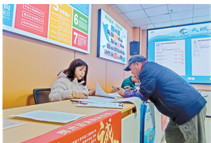
■长顺县人力资源市场(零工市场)为群众提供就业服务。