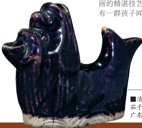
■清 茄子釉鱼化龙口哨 广东省博物馆藏