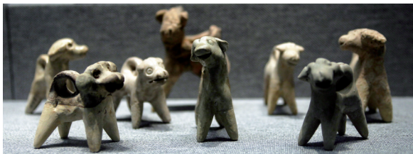
■1956年荔湾区西村窑遗址出土的宋代“玩具一组”。 南汉二陵博物馆