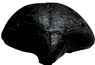
▲史前黑陶菱形口哨 新石器时代 广东省博物馆藏

跟纸拍片有类似“命运”的,在千万年的人类历史长河中,当然也多如繁星,日前,由广东省博物馆主办的“一起玩:藏在博物馆里的玩具”正式开展,观赏不同种类的玩具,穿越文化脉络与历史长河,追寻那一段段美好的时光。