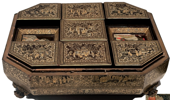
▲晚清 清漆彩绘人物故事游戏盒 广东省博物馆