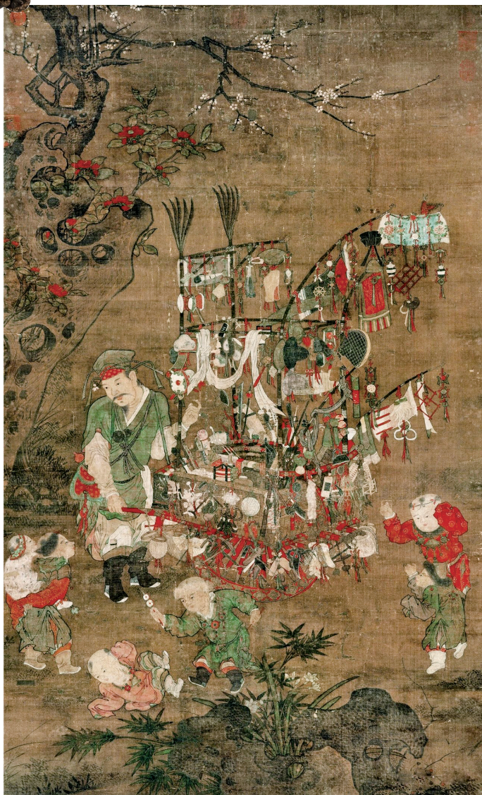
■北宋 货郎图 苏汉臣