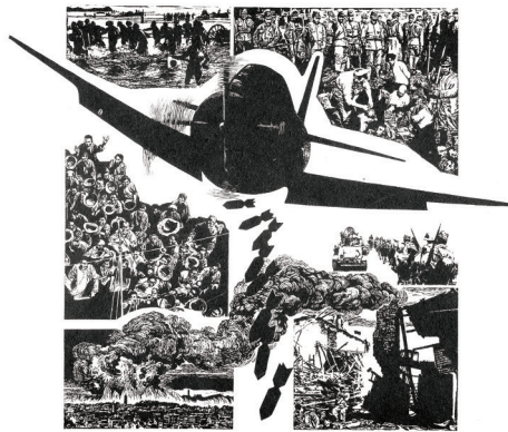
许钦松《在那个年代》 油印木刻 1982年

海》、冯国豪《抗日骑兵》等,艺术家以匠心为炬,于金石之中再现英雄气概、人民意志与胜利荣光;一件件作品,恰似一簇簇不灭的薪火,承载厚重的家国记忆,传递坚定的使命担当,生生不息地赓续着中华民族的精神血脉。