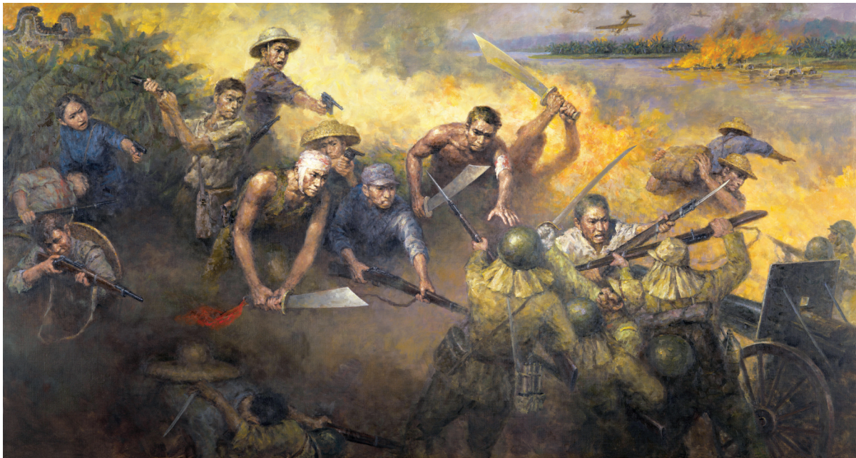
潘家俊《东江怒火》油画

在当代的广东美术界,也有表现有关抗战的题材,且佳作频出,版画、国画、油画以及雕塑的经典作品都不在少数。在百业昌盛的当下,广东美术家依然不忘先辈抵御外敌的艰难岁月,继续通过画笔反映战争的残酷,表现人们对战争的厌恶,一件件作品,恰似一簇簇不灭的薪火,承载厚重的家国记忆,传递坚定的使命担当,生生不息地赓续着中华民族的精神血脉。