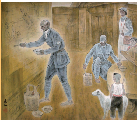
张弘《晋察冀边区纪事》