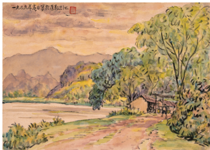
■胡根天《三江风景组图之三》纸本竹笔水墨 1939年 私人藏

1892—1985，原名毓桂，广东开平人。先后创立赤社美术研究会和广州市市立美术学校。曾任广州市市立美术学校校长、广东省立艺术专科学校教务主任、广州博物馆馆长、广州美术馆馆长、广州市文史研究馆馆长等职。