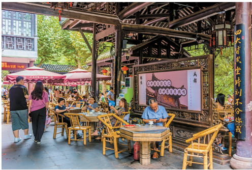
■成都人民公园鹤鸣茶社

“少不入川”，蓉城成都的“安逸”生活状态早已深入人心，7月的成都人民公园，更是悠悠然临水叹茶赏荷的妙处所在。