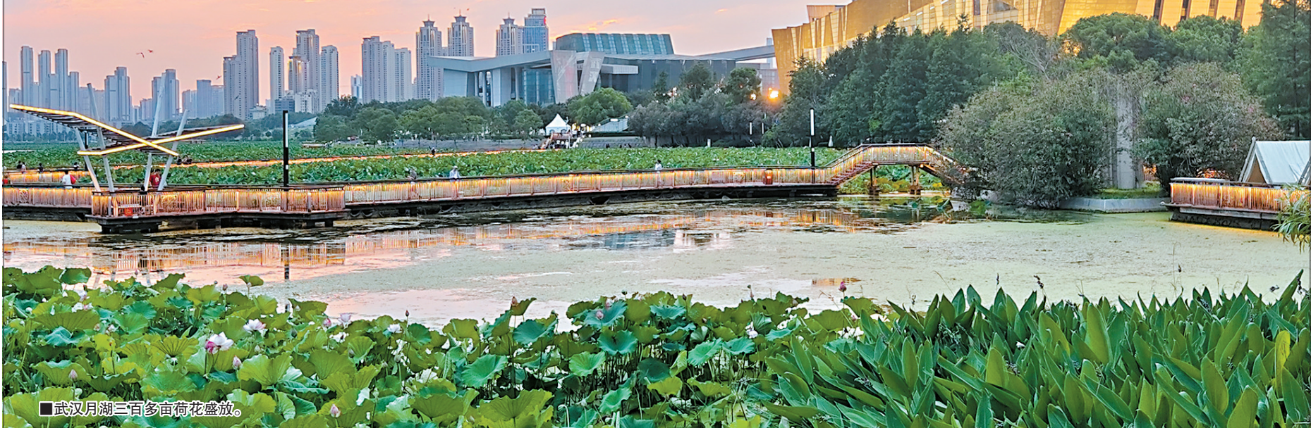
■武汉月湖三百多亩荷花盛放。