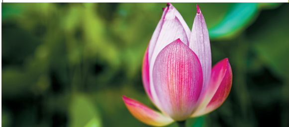
■成都人民公园的夏日荷花如凌波仙子惹人爱。

倘若时间充裕，也可以选择非日光当头照的夜晚时段去赏荷吹夏风，夜幕降临下的人民公园，月光与灯光交汇，有如给荷花蒙上一层柔和的光影滤镜，披上一层朦胧似雾的轻纱，白天清晰的轮廓隐没在夜色柔光中，勾勒出绰绰剪影，别有一番暗香浮动的美。