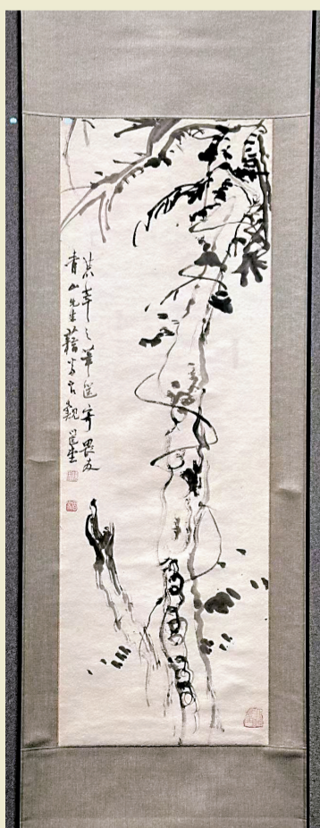
■水墨藤木图 饶宗颐

范正红: 因为西泠印社120年长期的积累,汇聚了文化艺术特别是篆刻、书画等领域的众多精英,许多系引领时风的大家。前辈像吴昌硕、启功、沙孟海、饶宗颐、李叔同、黄宾虹、潘天寿、傅抱石等等这样一众宗师级人物,成为印社的骨干,引领着西泠的风尚,自然会有很强的吸引力。再加上西泠印社的社员人数一直很少要求很高,这无形中就抬高了入社的门槛。