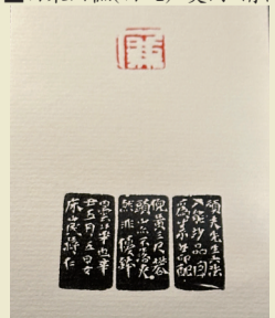
■ 廉(白文) 蒋仁 清代