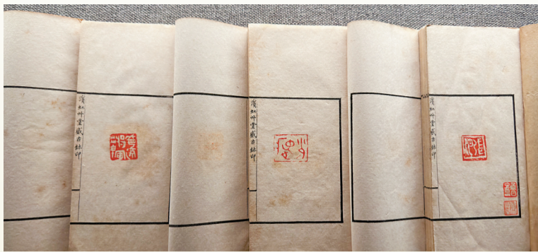
■ 宾虹草堂藏印 黄宾虹辑拓 民国

谈及西泠印社与广东印人的关联，除了第七任社长是来自广东的饶宗颐先生之外，过去百年间，西泠印社与广东艺术界都有密切的来往。广州市书法家协会主席梁晓庄接受新快报收藏周刊记者采访时表示，岭南印学社团的兴起是与西泠印社密不可分。