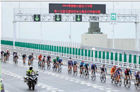
■港珠澳大桥 项目:公路自行车(4金)