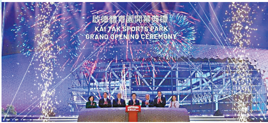
■香港启德体育园 项目:击剑(12金)手球(1金)7人制橄榄球(2金)

这是全运会首次走出传统体育场馆,在城市户外开放空间举行闭幕式。本次闭幕式以“星辰大海”为主题,整场演出将在海天之间展开,融合跨海大桥、港湾码头与周边建筑等多维空间,呈现一场前所未有的“城市全景闭幕式”。闭幕式还将实现粤港澳三地联动,共同奏响一曲动人的“大湾区交响乐”,为这场体育盛事画上华彩句点。