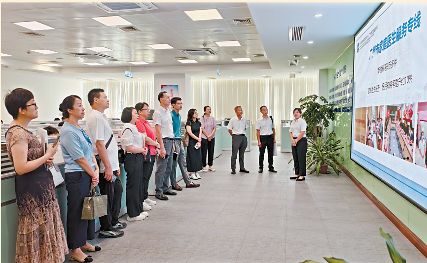
■两地进一步创新医疗协作模式。