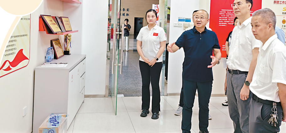
■开展交流学习活动。

资源的注入推动了学科专科的集群发展。惠水县人民医院在广州专家帮扶下,建成多个省级重点专科,对县域内常见病、多发病的救治能力提升50%;三都水族自治县人民医院建成省级重点专科产科,新建精神科,肿瘤防治中心挂牌运营,推动门诊人次同比增加37.86%,三、四级手术量同比增加30.58%。