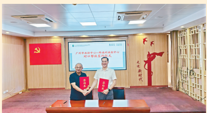
■广州市疾控中心与黔南疾控中心对口帮扶签约仪式现场。