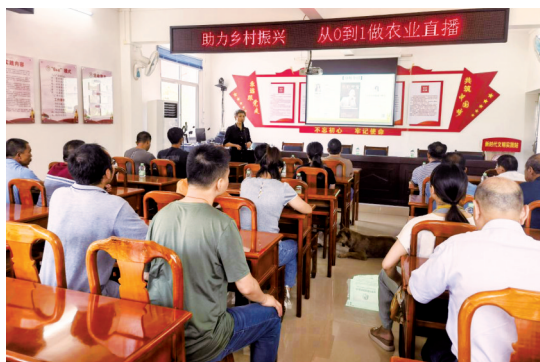
■驻梅州市平远县大柘镇帮扶工作队组织培训,帮助农户“从0到1做直播”。

新快报讯 记者朱清海报道 走进“田间课堂”,导师指导学员们就地学习如何搭建直播间、让网络流量变销量……近日,驻梅州市平远县大柘镇帮扶工作队(以下简称“工作队”)牵线搭桥,协调组团帮扶单位广州开放大学,在大柘镇杉坑村组织了一场主题为“从0到1农业直播带货,赋能乡村产业发展”的农业直播带货培训活动,助力当地农产品走向更广阔的市场。