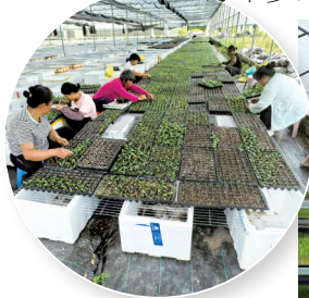
■太保镇的农户在丰乐公司的育苗基地内实现“家门口就业”。