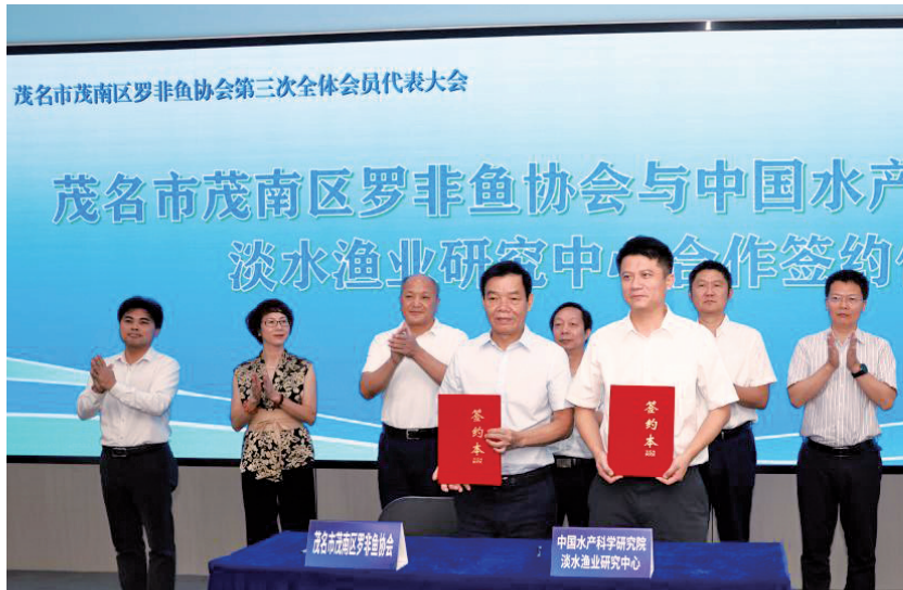
■茂名市茂南区罗非鱼协会与中国水产科学研究院淡水渔业研究中心签署合作协议。

超13亿尾,年产值超20亿元,多个超亿元项目落地,2025年成功入选国家现代农业产业园……茂南区罗非鱼产业取得了亮眼成绩。