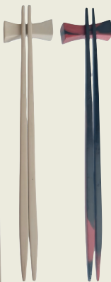
《楚骚回响·大漆乌木箸》张温帙