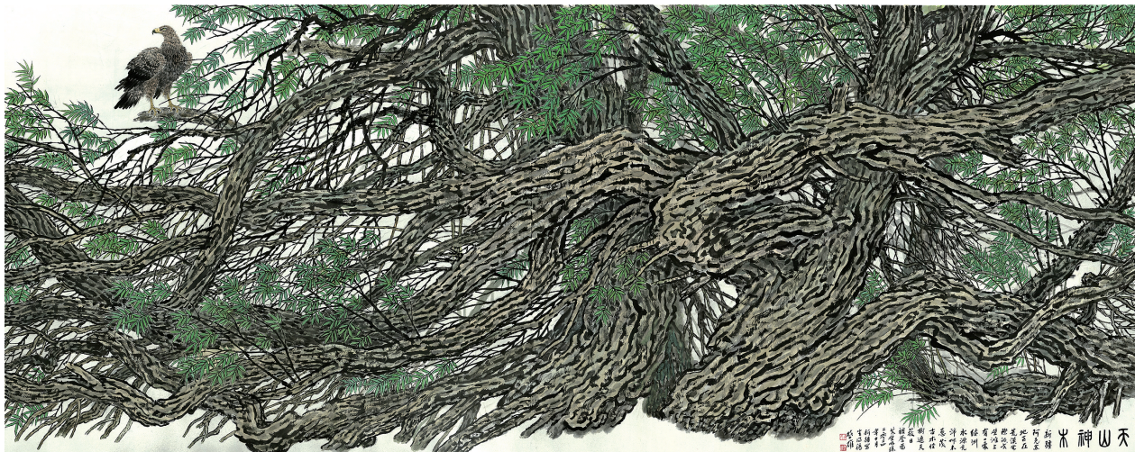
■天山神木 方楚雄 2024

林淑然1978年毕业于广州美术学院中国画系,1979年与方楚雄喜结连理。她在工笔技法上不断钻研,巧妙利用线条精细勾勒,凭借女性特有的细致情感和敏锐观察力,将花鸟的形态与神韵完美呈现于画纸之上。她笔下的花鸟或灵动活泼,或静谧优雅。工笔优秀