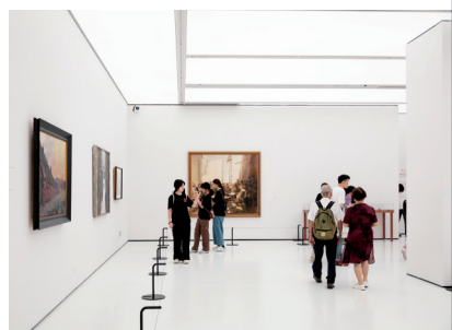
■北京画院藏钟涵艺术研究展现场

8月8日,“抹去重来六十年——北京画院藏钟涵艺术研究展”在广东美术馆新馆开幕。本次展览是“文化和旅游部2024年全国美术馆馆藏精品展出季优秀展览巡展扶持项目”,由中国美术家协会、中央美术学院、中国油画学会、中国艺术研究院油画院、广东美术馆、北京画院共同主办。