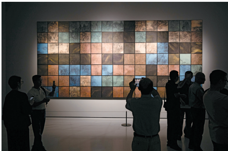
■第60届威尼斯国际艺术双年展中国馆回归展(广东站)