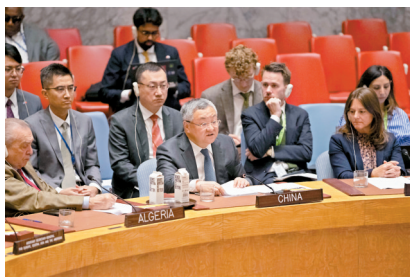
■8月10日,在位于纽约的联合国总部,中国常驻联合国代表傅聪(前排中)在安理会巴以问题紧急公开会上发言。