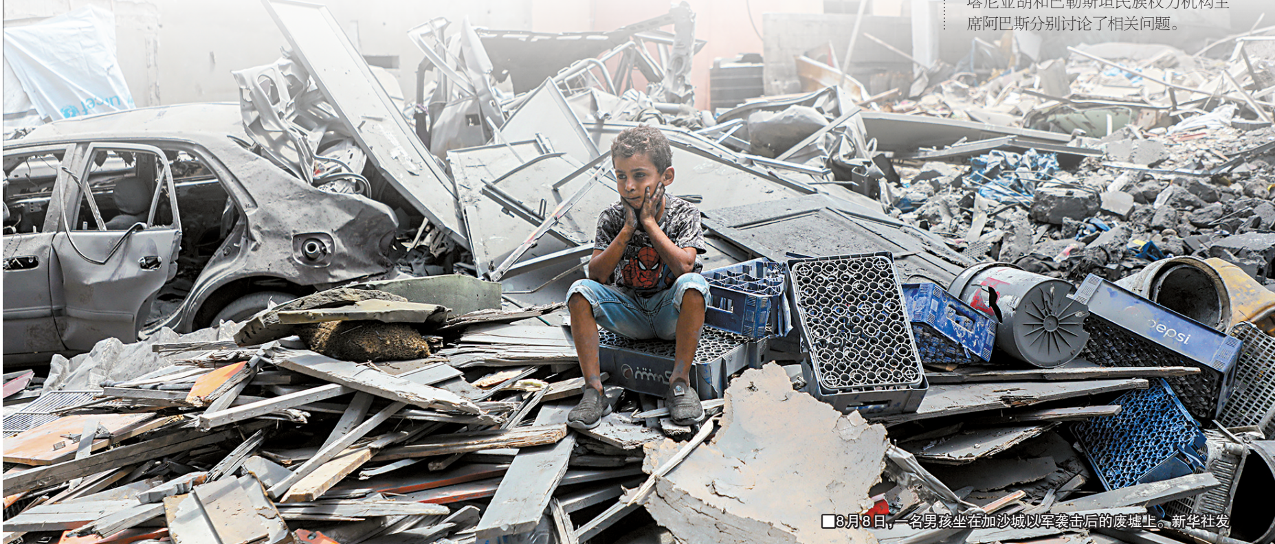
■8月8日,一名男孩坐在加沙城以军袭击后的废墟上。

另外,德国总理弗里德里希·默茨本月8日宣布,德国暂停向以色列出口任何可能用于加沙地带的军事装备。据瑞典斯德哥尔摩国际和平研究所数据,2019年至2023年,以色列进口的武器装备中,约69%由美国提供,约30%来自德国。