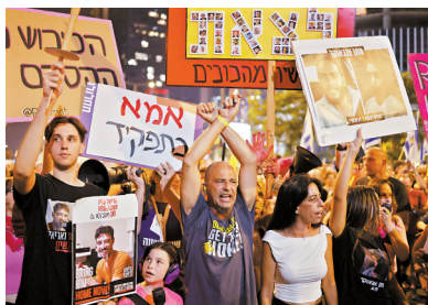
■8月9日,以色列民众手持被扣押人员的海报在特拉维夫参加游行集会。