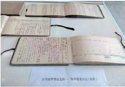
■《保科德光日记》记录了日军侵华罪行。