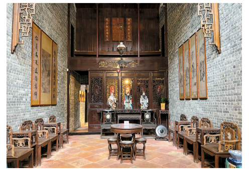
■正厅是整栋建筑气氛最庄严、最为核心的地方。