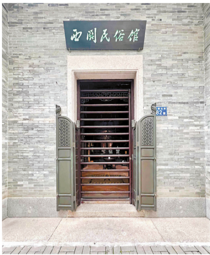
■趟栊门是最具岭南特色的建筑构件。

西关大屋给人的第一印象一定是“高”，房屋高大，门庭高大，正厅依然高大，基本是5米高度起步。