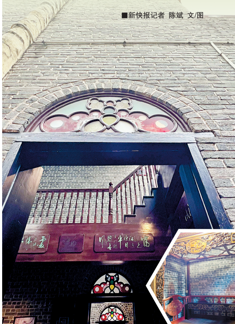
■西关大屋内部有很多细节值得称道。