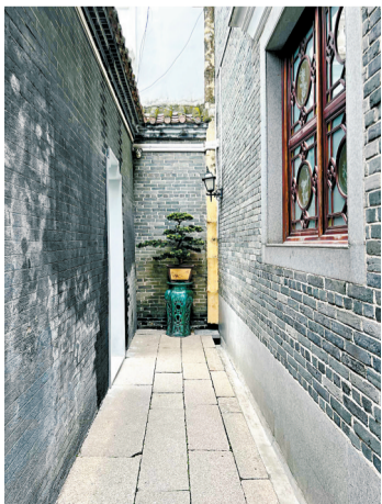
■青云巷取“平步青云”之意。