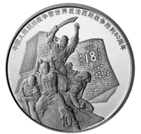
■中国人民银行将陆续发行中国人民抗日战争暨世界反法西斯战争胜利80周年纪念币。图为“30克圆形银质纪念币”。

2025年9月3日起，中国人民银行将陆续发行中国人民抗日战争暨世界反法西斯战争胜利80周年纪念币。其中，“30克圆形银质纪念币”同样采用了《大刀进行曲》雕塑作为主题图案。张勇认为，“从雕塑的创作背景及其符号化表达，到多次入选纪念抗战胜利的邮品设计，其艺术形象既是对历史的凝练再现，亦成为民族精神传承的视觉载体。”