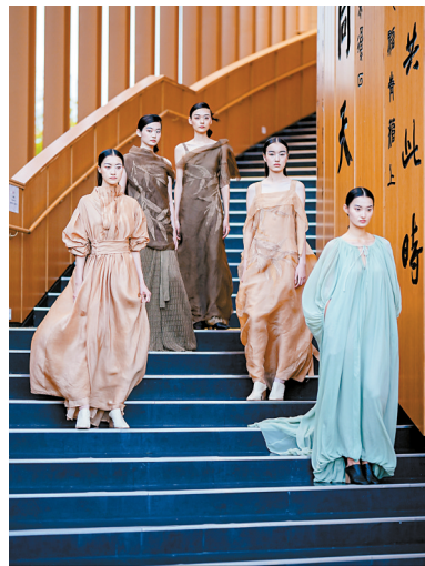
■“经纬共生——例外主题日”活动。