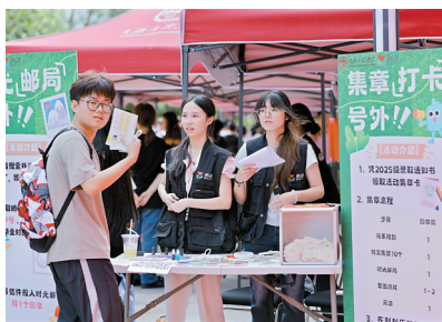
■8月31日,星海音乐学院迎新现场。

■采写:新快报记者 王娟 实习生 蔡思彤 通讯员 王若琳 丁雯洁 ■摄影:新快报记者 龚吉林