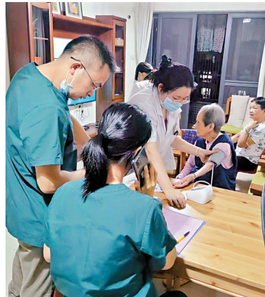
■联动医疗资源为长者提供上门体检服务。

构建“政府+企业+社工+志愿者+医疗”多维联动机制,整合“百医护老”资源,推出涵盖生活关怀、健康管理、应急救助的标准化服务包。重点解决就医难题,落实志愿者提供“助医陪诊”服务,帮助长者解决就医难题。