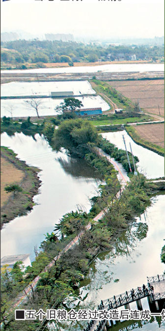
■五个旧粮仓经过改造后连成一体,成了先锋天下粮仓书店。