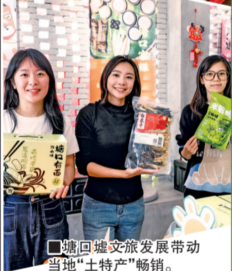
■塘口墟文旅发展带动当地“土特产”畅销。