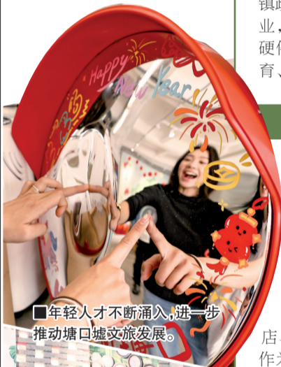
■年轻人才不断涌入,进一步推动塘口墟文旅发展。

为此,新快报记者通过实地采访,将陆续展现这些地域特色鲜明、具备较强IP潜质的项目,它们既体现了广东的地理多样性,更因地制宜创新打造了农文旅融合发展的广东样本。