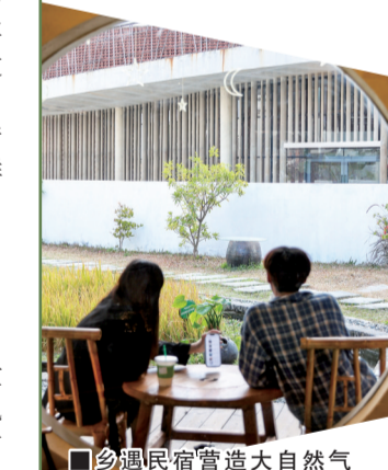
■乡遇民宿营造大自然气息吸引游客。