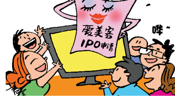
陈春鸣 / 画

羊城晚报记者 吴海飞 单品毛利高达98%(完胜茅台)，近期生产医疗整形用玻尿酸的爱美客递交了IPO申请，一举成为“网红”。不过暴利的背后却潜藏诸多隐患。公司近几年产能利用率一直不高，却要募资上马二期生产线，如何消化产能成一大问题。