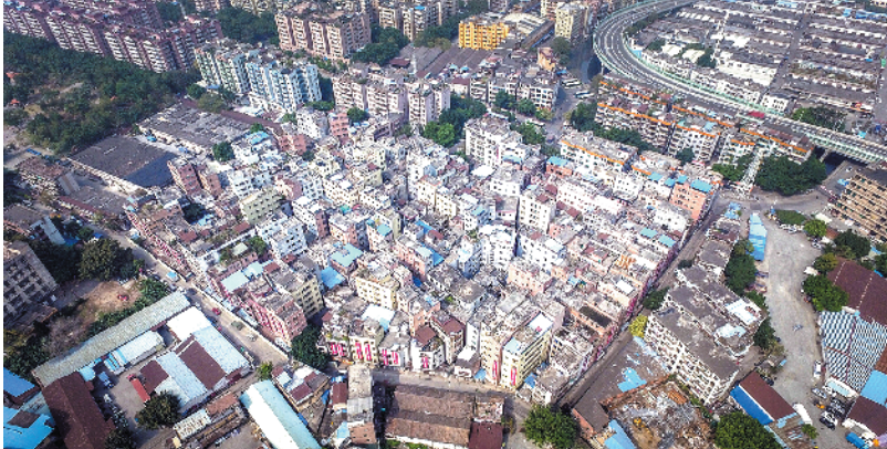
田心村城中村改造现场

3 年后将可回迁安置 自 2009 年广州启动“三旧”改造以来,广州市的城中村改造工作稳步推进。截至 2016 年底,广州已批复实施改造的城中村项目 42 个、用地面积 21 平方公里。而根据相关规划,到 2020 年广州市推进城市更新规模 85 平方公里。田心村项目位于白云区的南面,毗邻广州市重点发展的白云新城,用地 15.84 公顷,计容总建筑面积 38.99 万平方米,改造范围涉及房屋 320 栋,集资房 626 套,计划 3 年后回迁安置。以复建安置区为先,优先保障村民的居住安置。