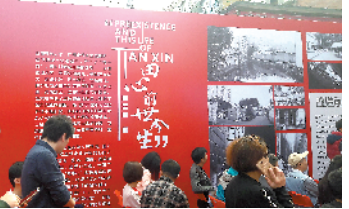
田心村举行拆迁动工仪式

3 年后将可回迁安置 自 2009 年广州启动“三旧”改造以来,广州市的城中村改造工作稳步推进。截至 2016 年底,广州已批复实施改造的城中村项目 42 个、用地面积 21 平方公里。而根据相关规划,到 2020 年广州市推进城市更新规模 85 平方公里。田心村项目位于白云区的南面,毗邻广州市重点发展的白云新城,用地 15.84 公顷,计容总建筑面积 38.99 万平方米,改造范围涉及房屋 320 栋,集资房 626 套,计划 3 年后回迁安置。以复建安置区为先,优先保障村民的居住安置。