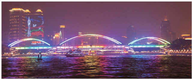
2018年灯光绚丽的海珠桥