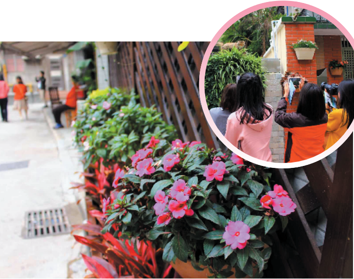
羊晚牵线搭桥,老社区成广州绿化微改造范本