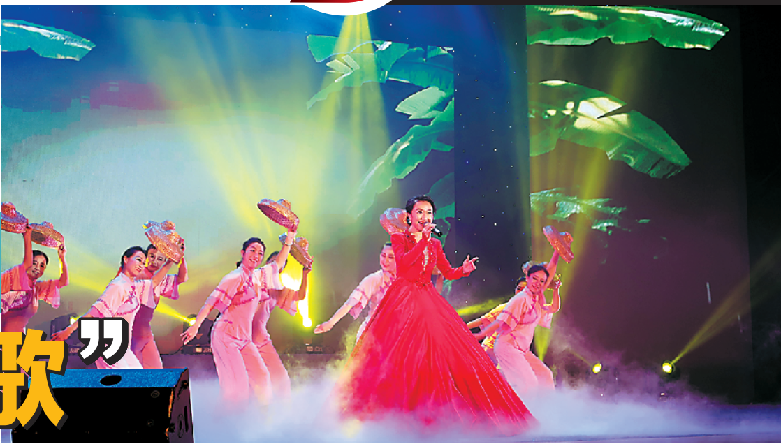
晚会表演洋溢浓浓的岭南风情