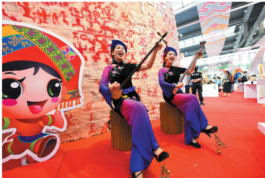
广西展位展示壮族女子天琴古乐《唱天谣》，天琴为壮族所特有，已流传千年

昨天上午，第14届中国(深圳)国际文化产业博览交易会(以下简称“文博会”)在深圳会展中心开幕。文化创意产业已成为深圳经济发展的重要支柱，而“文化+科技”更成为深圳创新发展的“加速器”。第十四届文博会作为深圳文化产业成果集中向世界展示的重大舞台，一大批深圳本土企业通过文博会发展壮大、走出深圳、走向世界。