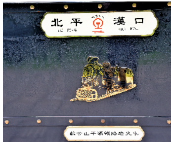
老式的火车的内饰