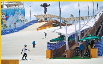
美的鹭湖探索王国旱雪基地