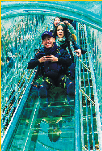
三水南丹山玻璃滑道