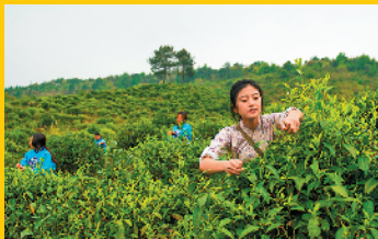
黄垚镇茶园开采春茶