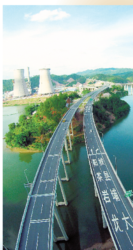
梅大高速及其东延线全线贯通，加快大埔向海西的连接

公里都翻了7倍，从根本上改善了该县落后的交通面貌。同时，该县还重点抓好县城至高陂连接线、农村“四好”公路建设，争取大丰华高速丰顺至大埔段早日动工；推进县城至枫朗一级公路、县城至茶阳公路和大麻至高陂旅游公路等工程建设，改造提升国省、县道，形成“对外大连通、对内大循环”新格局，努力实现“大交通带动大物流、大物流激活大产业”。