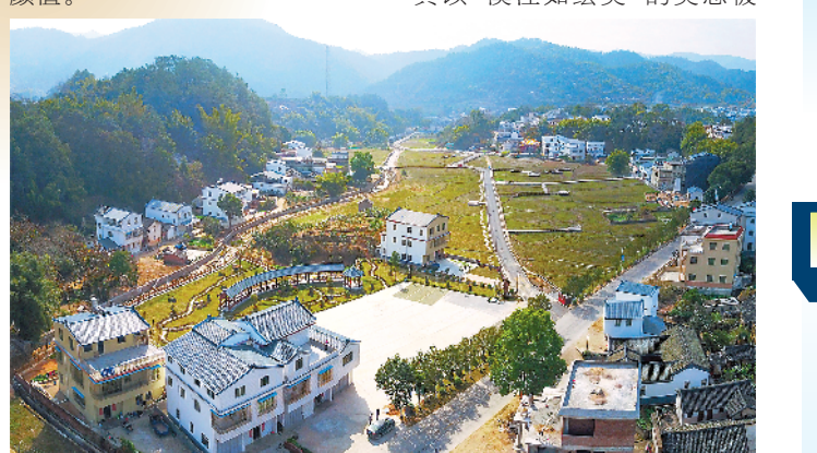
大埔西河镇黄堂村省级新农村示范片

这些只是大埔新农村建设的一个小片段。“大埔山清水秀，民风淳朴，客家人文深厚，真以‘溪江如画美’的美态被