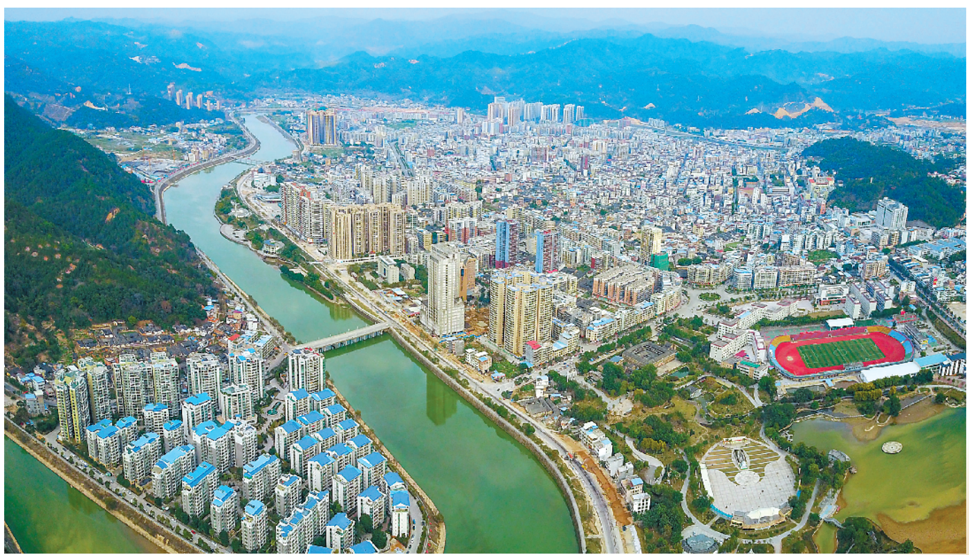
航拍2018年大埔县城