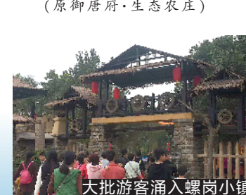
大批游客涌入螺岗小镇

相惜 绿树阴浓夏日长，楼台倒影入池塘。葡萄熟了整个夏天，看着好舒服，无聊的时候不妨到螺岗小镇坐坐，然后去风情街里感受琼楼玉宇；去百年湛江历史馆内感受源远流长；去螺旋桥上感受风和日丽。在清闲自在的日子里，与你手牵手，漫步螺岗小镇，沉醉于小镇的静谧美好，消磨一天的时光，享受慢节奏散漫生活。 组团咨询电话： 陈小姐 15875995334 郑小姐 18802578940 螺岗小镇地址：湛江市遂溪县岭北镇螺岗岭·御唐府螺岗小镇内 (原御唐府·生态农庄)