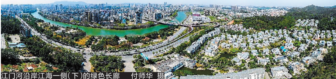
江门河沿江海一侧(下)的绿色长廊

高新区党工委副书记、管委会主任、江海区委书记彭章瑞形容，城央绿廊工程体现了高新区(江海区)践行以人民为中心的发展理念。实施城央绿廊工程目的在于满足人民日益增长的居住区域周边环境要求及生活品质要求。 会议指出，城央绿廊项目定位为市区老百姓休闲娱乐放松的滨水空间，一定要坚持“以人民为中心”的理念去谋划推动，要以“老百姓不高兴、认不认可、欢不欢迎、愿不愿意去”为根本出发点，让老百姓接触到水、亲近到水，给老百姓创造更多优质的公共空间；要切实好事办好、实事办实，要经得起历史考验、人民检验。坚持“整体规划、分步实施、先易后难、先示范后推进”的开发策略，保证20公里中漫步道、慢跑、骑行道“三道”全线贯通，充分考虑应用性和实用性，要跟现有的设施、环境相适应、相融合、相衔接，最大限度让“三道”亲近山水，凸显灵气，真正做出高新区(江海区)的特色和品位。