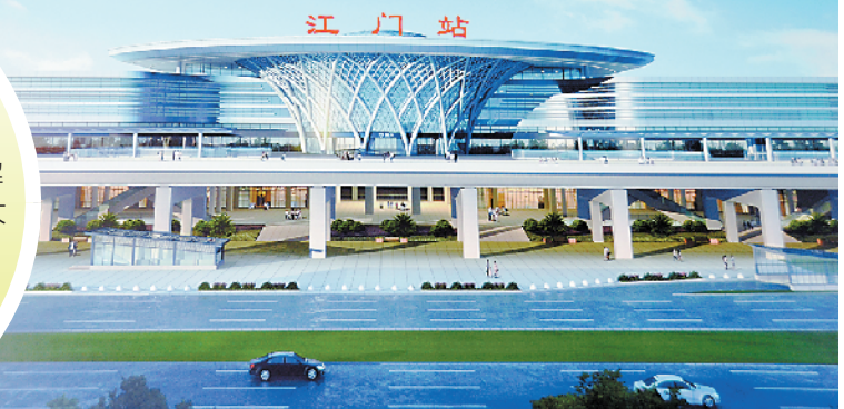
位于新会的珠西综合交通枢纽江门站效果图

江湛铁路即将通车，作为珠西综合交通枢纽江门站所在地的新会区，迎来一个千载难逢的发展良机。记者从新会区政府了解到，围绕这条未来沟通粤港澳大湾区东西翼的黄金通道，新会将从交通基建和城市建设方面大做文章，借此提升城市经济社会发展的水平。