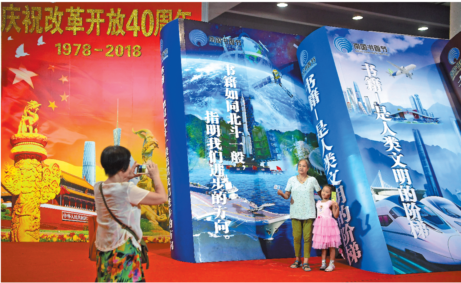
市民在南国书香节现场

羊城晚报讯 记者黄宙辉、孙唯，实习生罗梓茵，通讯员闻香报道：今天上午 9 时，2018 南国书香节暨羊城书展（以下简称“南国书香节”）开门迎接读者。今年书香节除了在广州设立主会场外，还在 19 个地级市全面设立分会场，实现书香节对全省所有地级市的全覆盖（注：中山和江门分会场已于 7 月中旬举办完毕），全省读者都可共享南国书香。