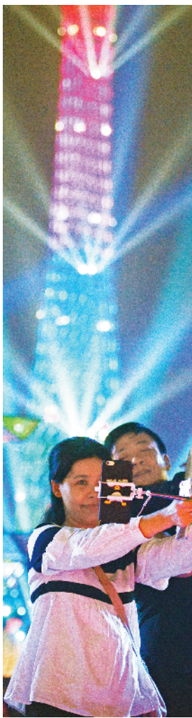
羊城晚报记者 邓勃 摄

羊城晚报讯 记者吴珊报道:近日,网上流传了多个帖子称,广州本地人不爱游广州塔,登塔的主要是外地游客。9 日,广州塔辟谣称上述信息不实。根据 2018 年 1 到 5 月的登塔数据,来自广东省的登塔游客数量稳居全国第一,约是第二名的 2.5 倍。其中,广州游客最爱游广州塔。