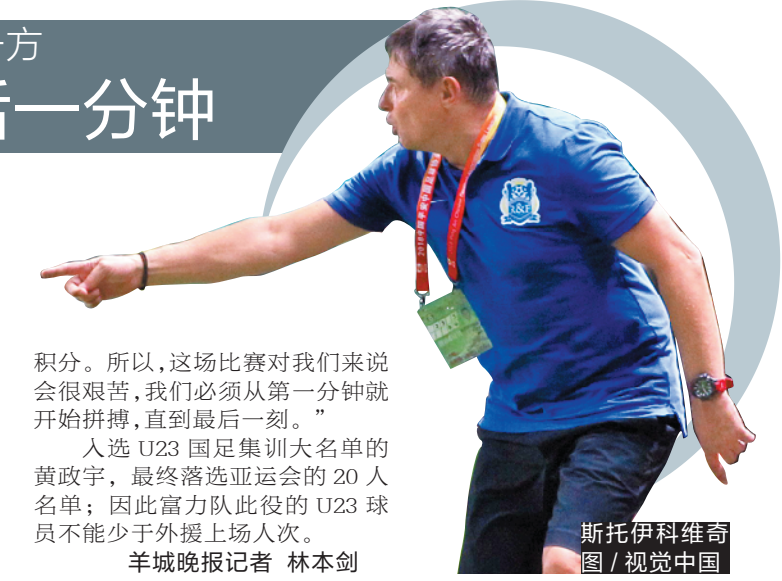
斯托伊科维奇图 / 视觉中国

积分。所以,这场比赛对我们来说会很艰苦,我们必须从第一分钟就开始拼搏,直到最后一刻。”