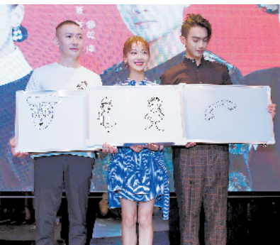
三位主创互相画像