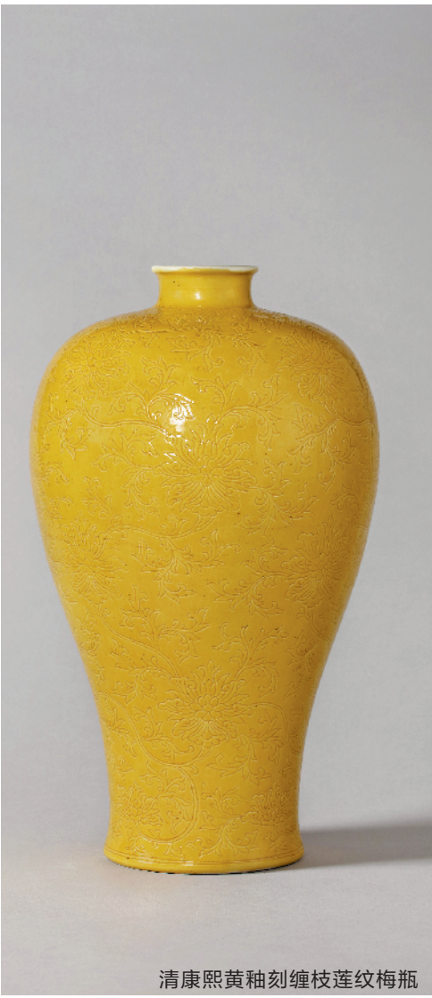
清康熙黄釉刻缠枝莲纹花瓶