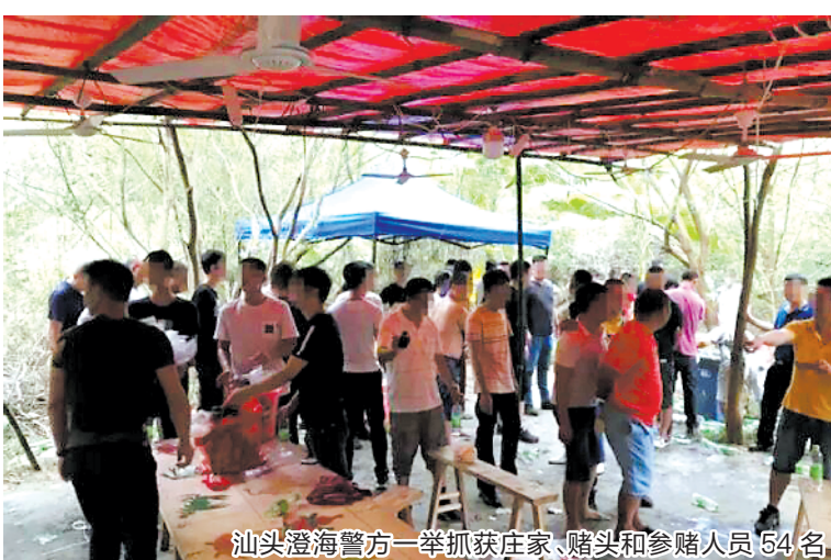
汕头澄海警方一举抓获庄家、赌头和参赌人员54名

羊城晚报记者 赵映光、通讯员澄公宣摄影报道:一个流窜于潮汕一带的“鱼虾蟹”赌博犯罪团伙,为了逃避公安机关的打击,不但派人盯风望哨,而且采取“东打一枪,西放一炮”的方式,不断变换聚众赌博地点,跟公安机关玩起了“躲猫猫”。