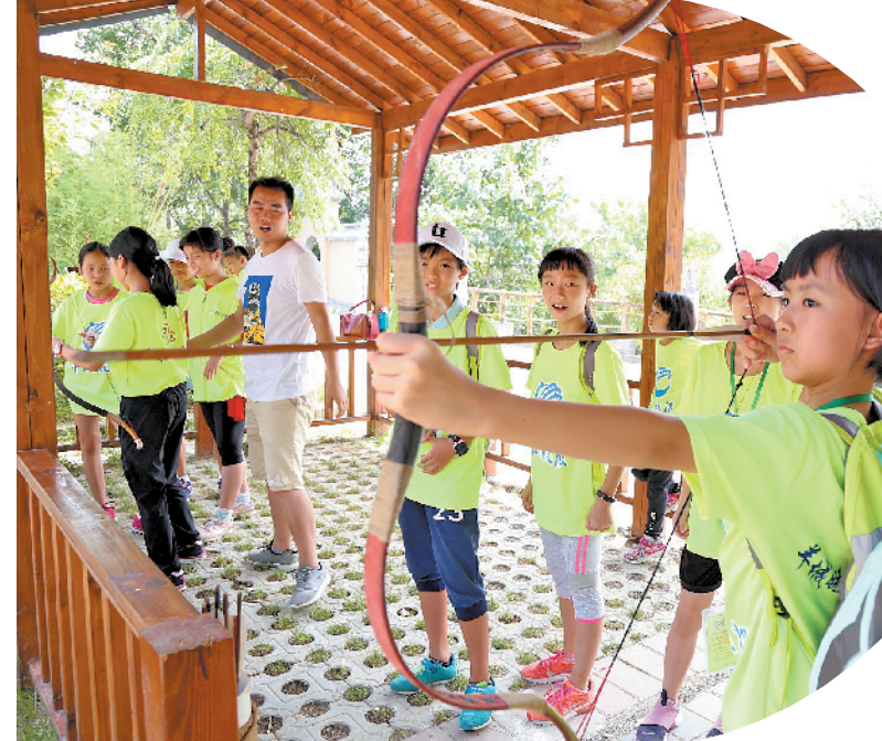
▲羊小记练习射箭 ▲老师为羊小记点朱砂开智

透过文物看历史 西安博物院陈列着我国各个历史时期的文物,高足玉杯、彩绘侍女俑、裸体俑、绿釉罐、白瓷罐、白瓷双龙柄壶……每一件文物仿佛诉说着一段历史。其中,彩绘侍女俑吸引了我的注意。彩绘侍女俑是唐朝文物,脸蛋圆嘟嘟的,身子胖乎乎的,衣着华丽长裙,体态丰腴而优美,神态端庄。有的双手摊开,有的端庄直立,形象生动。“噢!这么胖怎么可能是美女啊!”我旁边的小伙伴忍不住笑了出来,讲解员解释说唐朝以胖为美,这种美也相应地呈现出了当时雍容华贵的社会景象。我不禁感叹,如果现在以胖为美就好了,妈妈就不用那么辛苦减肥啦。